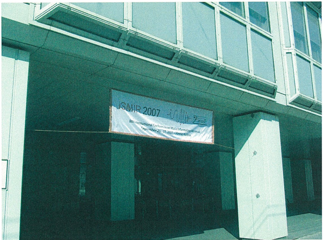
図2 ISMIR2007会場 (Vienna University of Technology)